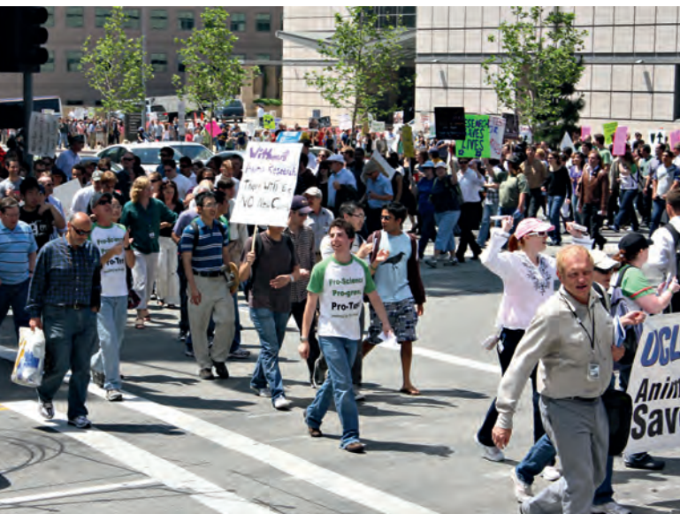
En las imágenes, marcha a favor de la investigación animal celebrada en la Universidad de California en 2009.

dos los proyectos de investigación que usan animales, además de pasar la evaluación ética, deben publicar un resumen no técnico en la web del Ministerio de Agricultura y Pesca, Alimentación y Medio Ambiente. 1 La finalidad de estos resúmenes es contribuir a la transparencia en la investigación y dar a conocer a la sociedad qué proyectos están usando modelos animales.