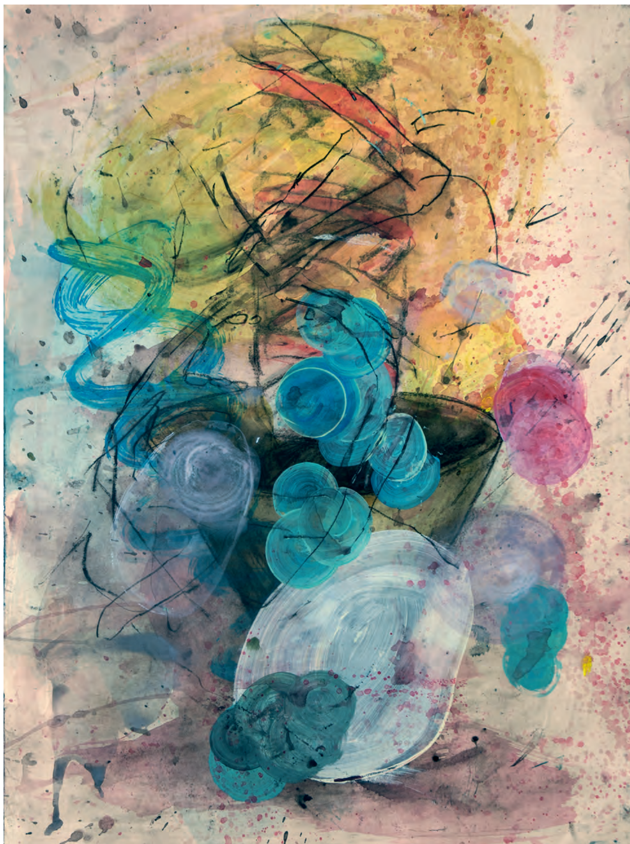
Jorge Carla. Surgimiento helicoidal , 2018. Técnica mixta sobre papel, 50 x 70 cm.