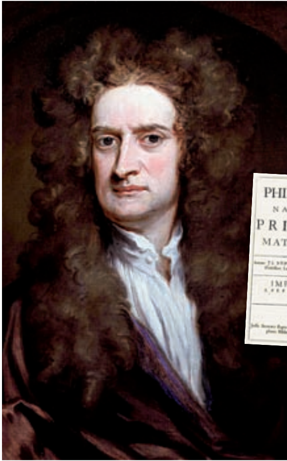
Sir Godfrey Kneller. Sir Isaac Newton , 1702 (detall). Oli sobre llenç, 62,2 x 75,6 cm. A la dreta, portada de la primera edició dels Philosophiæ Naturalis Principia Mathematica de Newton, on el físic desenvolupa la llei de gravitació.

de planetes havia romàs fix (Mercuri, Venus, Mart, Júpiter i Saturn, als quals, amb la reforma copernicana, es va unir la Terra). Abans d'aquesta reforma la Lluna no era un satèl·lit de la Terra sinó un cos celeste que, com tots els altres (inclòs el Sol, que no era concebut en absolut com un estel), girava al voltant d'una Terra immòbil situada al centre del món. Amb Copèrnic, tot va passar a desplaçar-se entorn del Sol, excepte la Lluna, que ho feia al voltant de la Terra. Per tant, quan a començament del segle XVII Galileu va orientar el seu rudimentari telescopi cap al cel, es tenia coneixement de sis planetes i un sol satèl·lit (de fet, a ull nu no s'aconsegueix veure'n més). No obstant això, gràcies a l'ampliació de la grandària dels