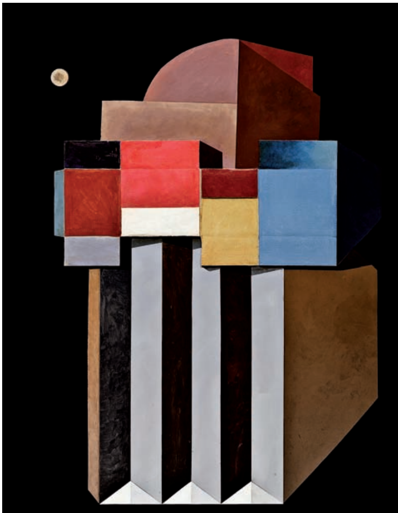
Nassio Bayarri. La casa del pare còsmic , 2009. Acrílic i cartró sobre taula, 195 x 225 cm.