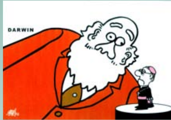
Forges. El País , 22 de febrero de 2009.

Así, la ironía y la sátira de las viñetas de humor se ocuparon también de la polémica que suscitó la publicación de El origen de las especies . Unos recursos que todavía hoy en día se pueden utilizar con el mismo objetivo, tal y como pudimos ver el año pasado en la III Muestra de Humor Gráfico, ¿Evolució o Creació? ,