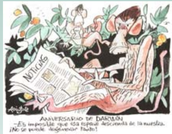
Mingote. Abc , 12 de febrero de 2009.

organizada por la Unió de Periodistes Valencians junto a la Caja de Ahorros del Mediterráneo y la federación de dibujantes de humor FECO España.